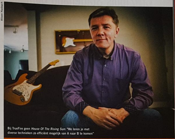
Bij TrueFire geen House Of The Rising Sun : "We leren je met diverse technieken zo efficiënt mogelijk van A naar B te komen"

staan, maar ook die in de schaduw werken. Ze moeten vooral een autoriteit zijn, theoretische kennis en speeltactiek hebben, en net zo veel plezier beleven in het maken van instructievideo's als wij."