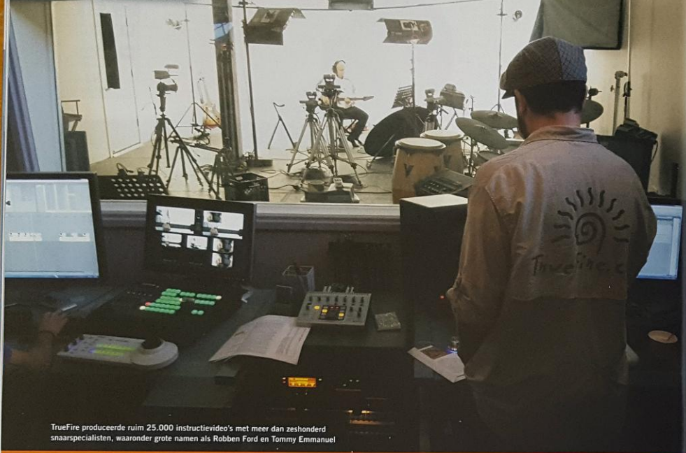
TrueFire produceerde ruim 25.000 instructievideo's met meer dan zeshonderd snaarspecialisten, waaronder grote namen als Robben Ford en Tommy Emmanuel

>> businessmodel functioneert niet. Met andere woorden: de artiest die je in beeld ziet - om wie het zou moeten draaien - verdient er te weinig mee. De eindgebruiker betaalt immers niets. TrueFire is een productiebedrijf, een uitgeverij en een clearinghouse (een organisatie die tussen handelaren inzit en onder meer de administratie van transacties bijhoudt - red.). Allemaal toegevoegde waarden voor de gitaristen die je op je beeldscherm aan het werk ziet."